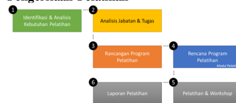
Gambar 2. Kerangka pengelolaan pelatihan